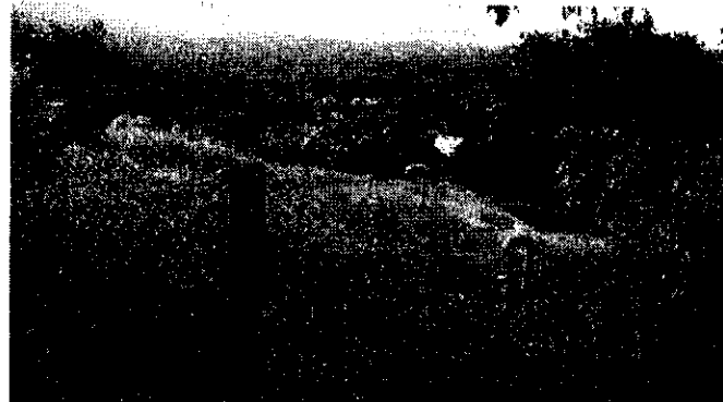
Figura 1. Tanques de almacenamiento de zona media

Los tres (03) tanques de almacenamiento de la zona media del sector de ciudad Teyuna presentan fugas, deterioro interno y externo lo que hace necesario que sean intervenidos técnicamente para poder dejarlos en óptimas condiciones.